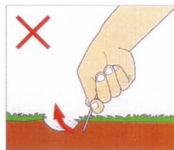
持ち上げてしまうと根が切れてしまう

年 月 日 ご予約者： _____ 様 _____ コース ( _____ 時 _____ 分スタート) コンペ名： _____ 組数： _____ 組 人数： _____ 名 希望グリーンフォーク本数： _____ 本 マナー責任者氏名： _____ 様